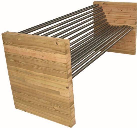
Version lamellé collé, longueur 1800 mm